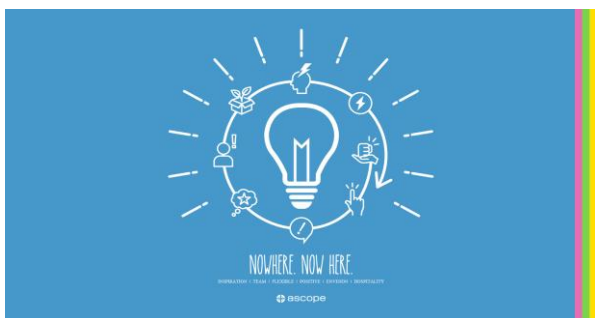
作成者：河合隆裕さん